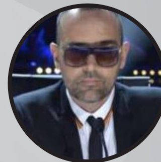
Risto Mejide, publicista

Has defendido tu trabajo como a poca gente le he visto hacerlo. A mi me has hecho volver a creer. ¡Enhorabuena!”